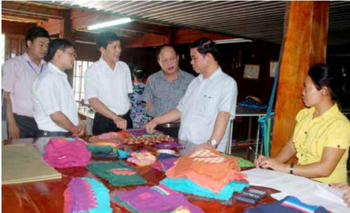
Chủ tịch UBND tỉnh thăm làng nghề dệt thổ cẩm người dân tộc Lô Lô, thị trấn Mèo Vạc.