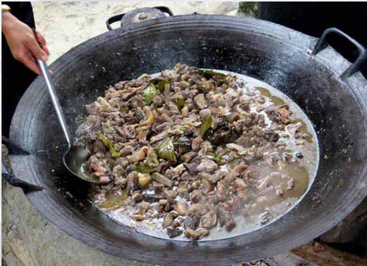
Ẩm thực Thắng Cố

Cách nấu thắng cố rất đơn giản, gia vị truyền thống gồm 12 thứ gồm thảo quả, hoa hồi, quế chi, sả, gừng và nhiều thứ gia vị bí truyền khác. Thịt và “lục phủ ngũ tạng” được rửa sạch, luộc chín, đôi khi còn được ướp trước với các loại gia vị, sau đó thả vào nồi nước dùng có xương ngựa, nội tạng, tiết và 12 loại gia vị kể trên đã được đun sôi, rồi cứ thế ninh như hàng tiếng đồng hồ. Những nồi thắng cố ở các phiên chợ vùng cao rất lớn, đủ cho vài chục người ăn, còn trong các nhà hàng, từ nồi thắng cố lớn, lúc ăn mới múc ra nồi lẩu rồi thái thịt ngựa thả vào.