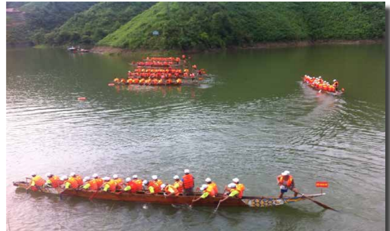
Lễ hội đua thuyền lần thứ 2 huyện Quang Bình năm 2014

Đối với danh thắng hồ thủy điện Sông Chùng nằm cách trung tâm huyện 6 km, toàn bộ khu vực lòng hồ có tổng diện tích trên 820 ha, trong đó diện tích đất tự nhiên là 590 ha, diện tích mặt nước là 230 ha, với tổng chiều dài lòng hồ trên 14 km, nằm trên địa bàn của các xã Tiên Nguyên, Tân Nam và thị trấn Yên Bình, là địa bàn cư trú lâu đời của đồng bào dân tộc Tày và Dao đỏ. Toàn bộ khu vực hồ Sông Chùng có các đồi, núi thấp không bị ngập nước đã tạo nên những hòn đảo nhỏ, hai bên bờ hồ có những hang động, thác nước và khu vực đồi lượn sóng, có ruộng bậc thang trải dài theo các triền đồi, có các thảm thực vật và những cánh rừng tái sinh được phủ kín, mặt hồ trong xanh gợi nên nét đẹp của vùng sơn cước, vùng đất sơn thủy hữu tình... đã tạo nên một bức tranh thiên nhiên đẹp mắt, là điểm nhấn để phát triển du lịch... Với những điều kiện nêu trên Đình Bản Chún cùng danh thắng hồ thủy điện Sông Chùng sẽ là điểm du lịch tâm linh, tín ngưỡng hấp dẫn thu hút các du khách trong