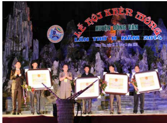
Đồng chí Vương Mí Vàng, Phó Bí thư Thường trực Tỉnh ủy, Chủ tịch HĐND tỉnh và đồng chí Trần Đức Quý, Ủy viên BCH Tỉnh ủy, Phó Chủ tịch UBND tỉnh trao Bằng xếp hạng Di tích cấp tỉnh cho 4 xã.

Phát biểu tại buổi lễ, đồng chí Trần Đức Quý, Ủy viên BCH Tỉnh ủy, Phó Chủ tịch UBND tỉnh, nhấn mạnh, Lễ hội khèn Mông được tổ chức lần thứ II đã thể hiện sự trân trọng đối với loại hình nghệ thuật độc đáo của