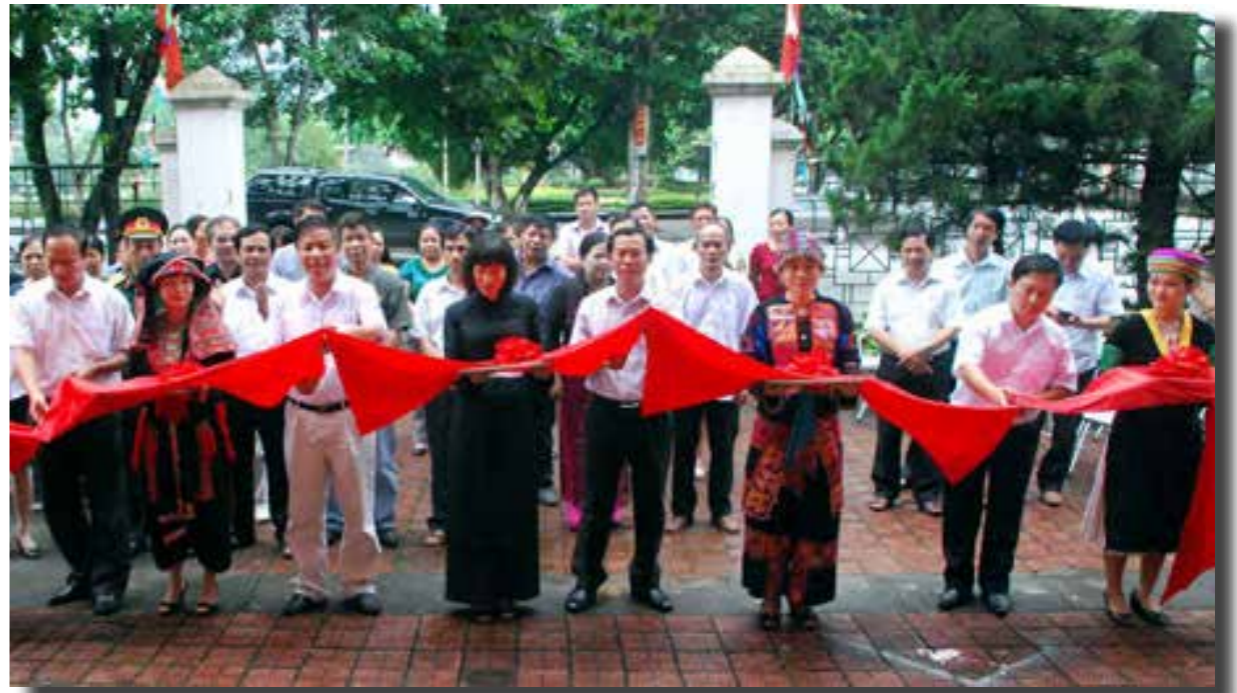
Lãnh đạo các đơn vị cắt băng khai trương triển lãm