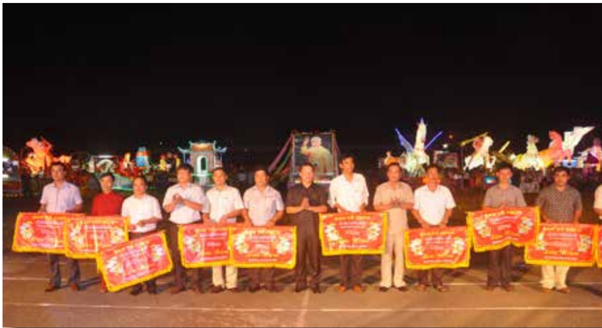
Lãnh đạo thành phố Hà Giang trao Cờ lưu niệm cho các đơn vị tham gia lễ hội.