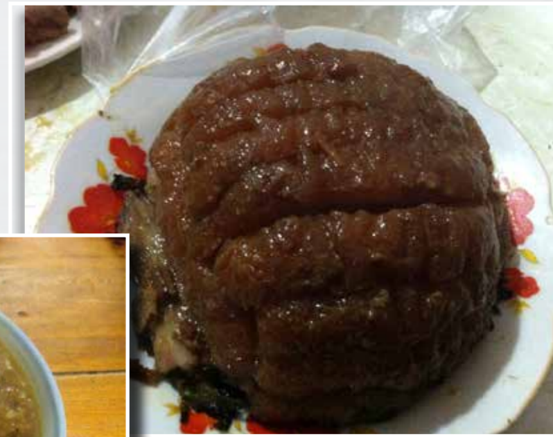
Món Khâu Nhục

Nhiều thực khách không quen với cách chế biến cũng như cách ăn thắng cố