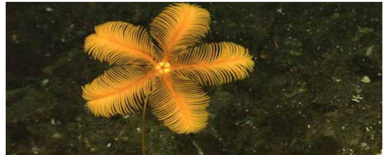
Tại Hà Giang các nhà khoa học đã tìm thấy 5000 mẫu hóa thạch của loài Huệ Biển