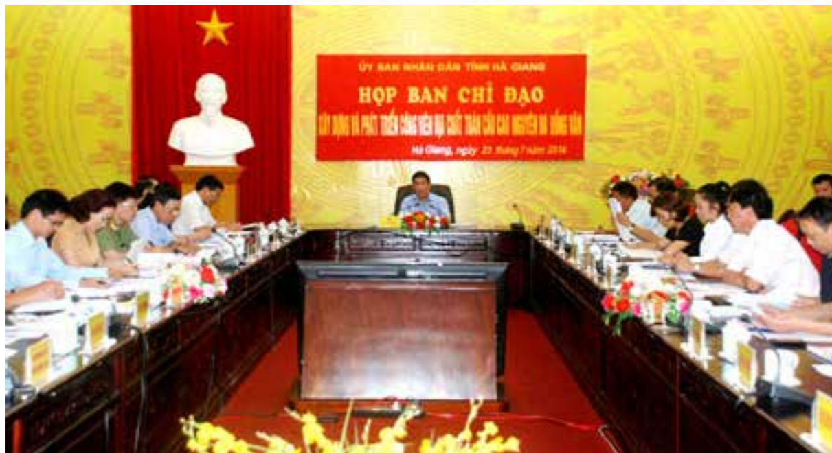
Toàn cảnh họp BCĐ Xây dựng và phát triển Công viên địa chất toàn cầu Cao nguyên đá Đồng Văn

Thời gian qua, các ngành, các cấp tích cực triển khai, thực hiện nhiệm vụ được giao nhằm chuẩn bị tốt nhất cho việc tái đánh giá Công viên địa chất của Mạng lưới Công viên địa chất toàn cầu được thực hiện vào đầu tháng 8 tới. Đã hoàn thiện hệ thống biển, bảng pano, biển chỉ dẫn thuyết trình về các điểm di sản địa chất, di sản văn hóa và đa dạng sinh học. Hoàn thiện hệ thống trưng bày, giới thiệu giá trị di sản Công viên địa chất tại 4 huyện vùng cao. Đang khẩn trương hoàn thiện cơ sở hạ tầng tại các điểm dừng chân và bãi đỗ xe.