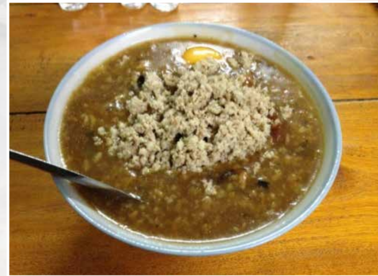
Ẩm thực cháo Ấu Tẩu

Để thưởng thức thắng cố với hương vị nguyên bản, du khách nên đến với những phiên chợ của người H'Mông ở Đồng Văn – Hà Giang, nơi mà cách nấu và nguyên liệu nấu thắng cố vẫn chưa bị cải biến đi nhiều. Những bát thắng cố được múc ra phục vụ thực khách từ những chảo lớn sóng sánh thịt nạc, thịt mỡ và lục phủ ngũ tạng. Nội tạng ngựa được chế biến sạch có mùi thơm, ăn rất giòn, thịt ngựa bùi bùi, ngọt ngọt, ăn kèm với các loại rau nhúng như cải mèo, cải ngồng, cải lấu,... chấm với loại nước chấm gia truyền nổi tiếng cay, nồng, giúp thực khách xua tan đi cảm giác rét mướt của núi rừng vùng cao.